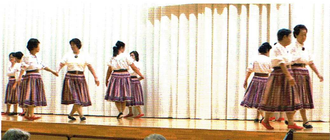
フォークダンス若草