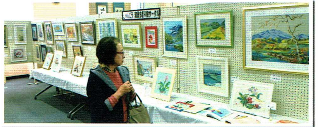
和紙ちぎり絵サークルの展示作品