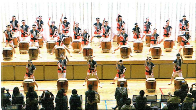
新屋地区／栗田支援学校祝い太鼓

新屋高校吹奏楽部の演奏に始まり、踊りや迫力満点の太鼓演奏など、18のプログラムはどれも素晴らしい内容に、会場いっぱいの観客は惜しめない拍手を送っていました。また、最後には創作太鼓への熱烈なアンコールもあって、とても盛り上がった「おらほの町自慢」になりました。