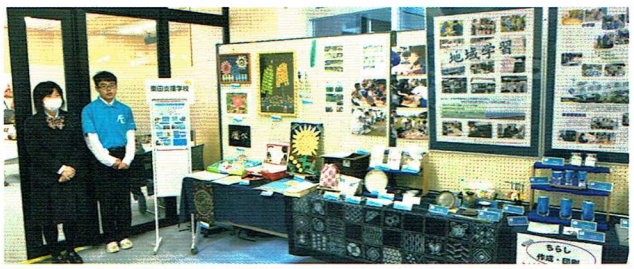
栗田支援学校の展示作品