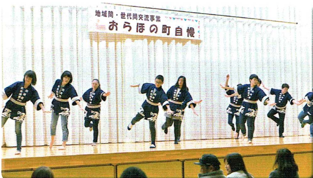
浜田地区／浜田音頭