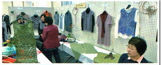
編物サークルの展示作品