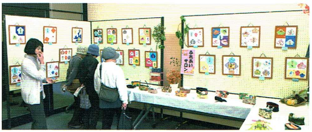
ふれあいサロンの展示作品