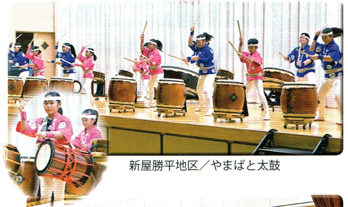
新屋勝平地区／やまばと太鼓