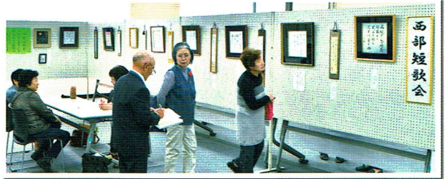
西部短歌会の展示作品

今回は天候にも恵まれ、2日間で昨年を上回る1,958名が来場、両日も大賑わいのウエスターまつりとなりました。