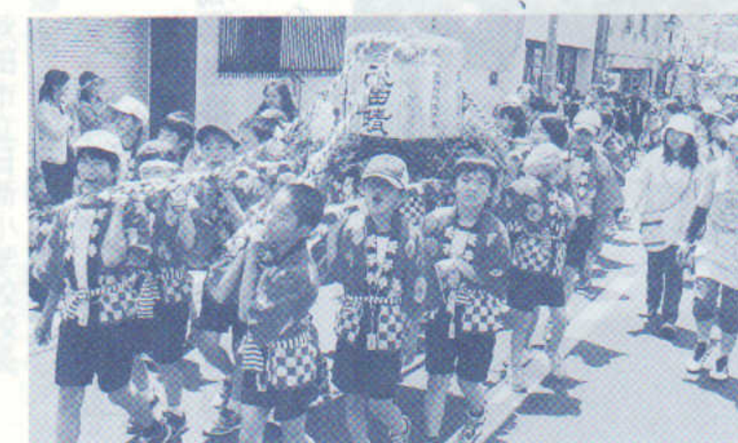
「子どもみこし」で日吉山王祭に参加する日新っ子

いいますので、日新小学校へのなお一層のご厚情とご鞭撻を賜りますようお願い申し上げます。