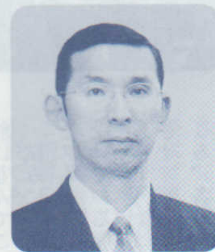
秋田市立日新小学校