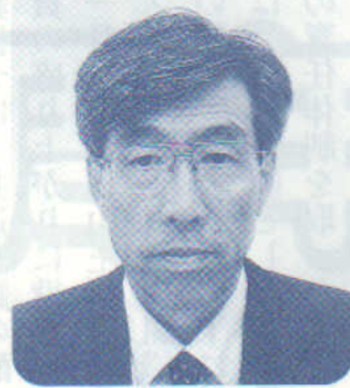
秋田市立秋田西中学校