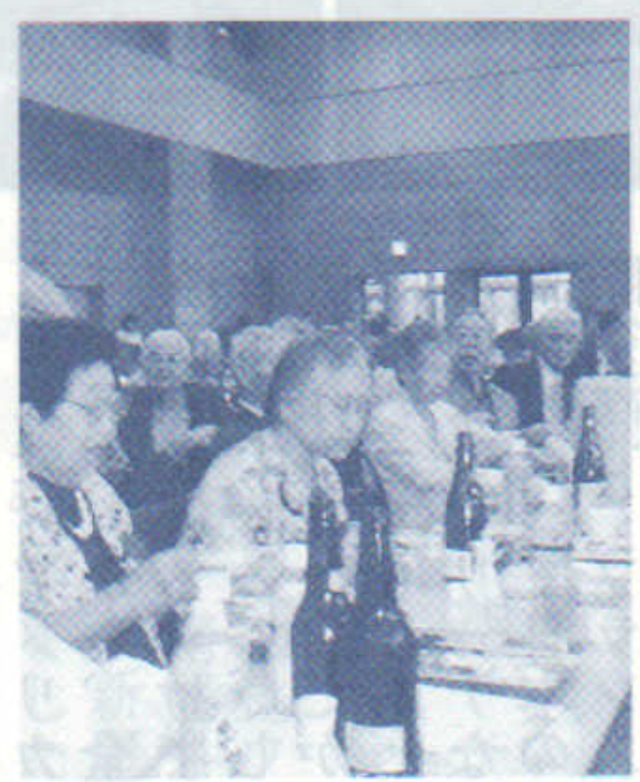
談笑される招待された皆さん

主催者・来賓の祝辞、励ましの言葉を賜り、婦人会から記念品を頂き、大変楽しい一日でした。会場に入るときから