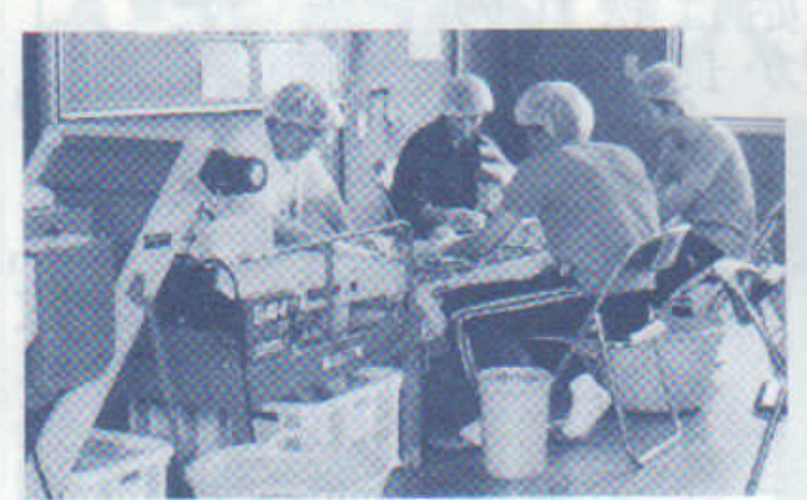
枝豆調整・袋詰め風景

さて、本校は新屋地区の各行事やボランティア活動に積極的に参加し、皆様との交流を深めて参りました。昨年度は初めての試みとして、生徒が地域農家でボランティア活動を行い、収穫の喜びを体験しました。この作業は、地域が集団化を目指して栽培している枝豆の収穫・調整・袋詰めであり、キャリア教育の面からも、また体験学習としても、今後の進路実現に大きな意味をもつものと思えます。今春以降本格始動いたします本校の新しい学校設定科目「地域コミュニケーション」においても、ますます皆様との交流を活かした活動を進めて参りたいと考えております。