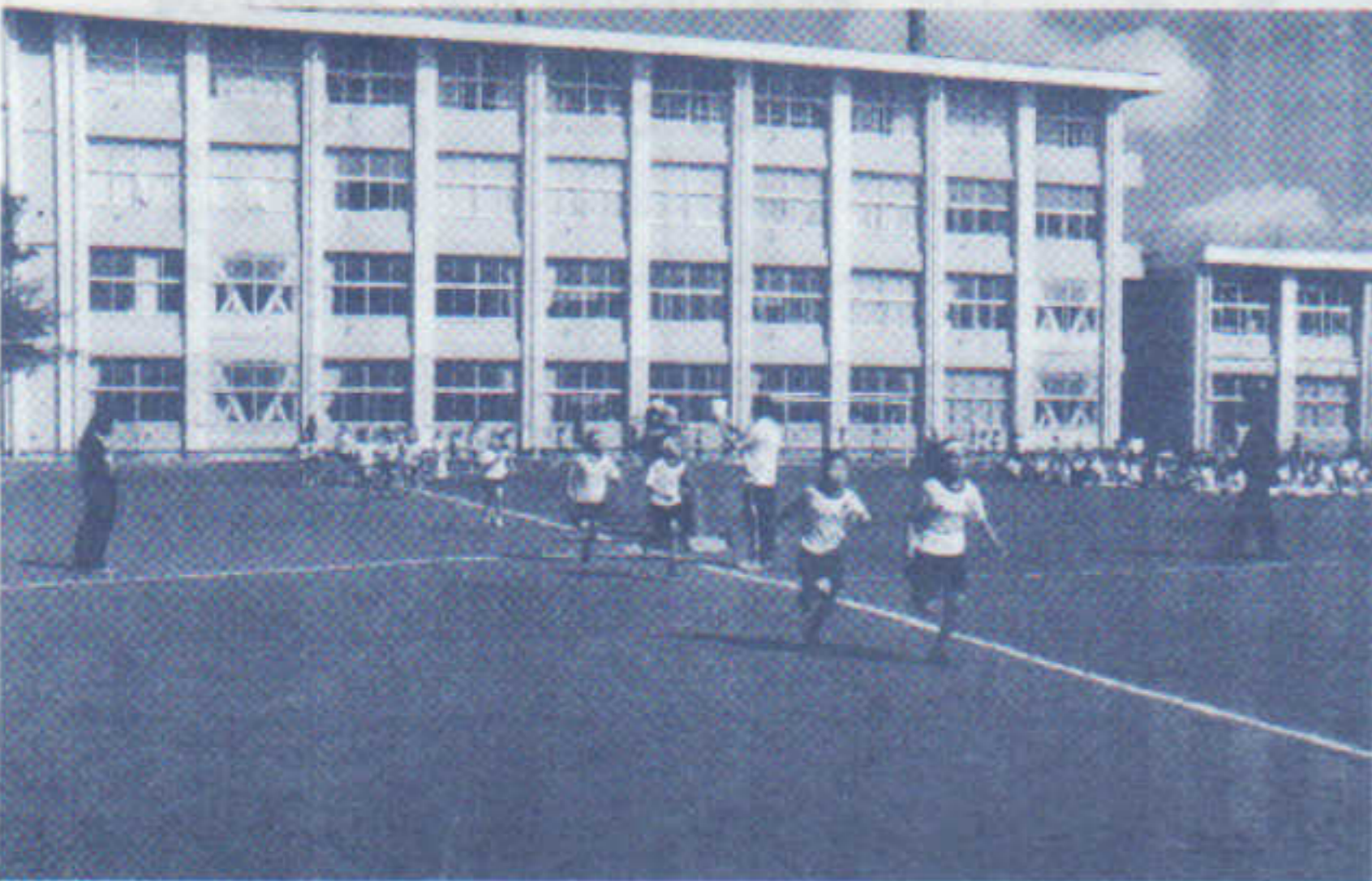
平成22年度から始まった「日新きらめきマラソン大会」

保護者の皆様 の温かいご理解 とご協力のもと、 地域の皆様の方 強い支えをいた だきながら、本 年も「子どもた ちが、自らをよ りよく高めよう とする力を身に 付けること」に 全教職員が一丸 となって力を注 いでまいります。 どうぞよろし くお願い申し上 げます。