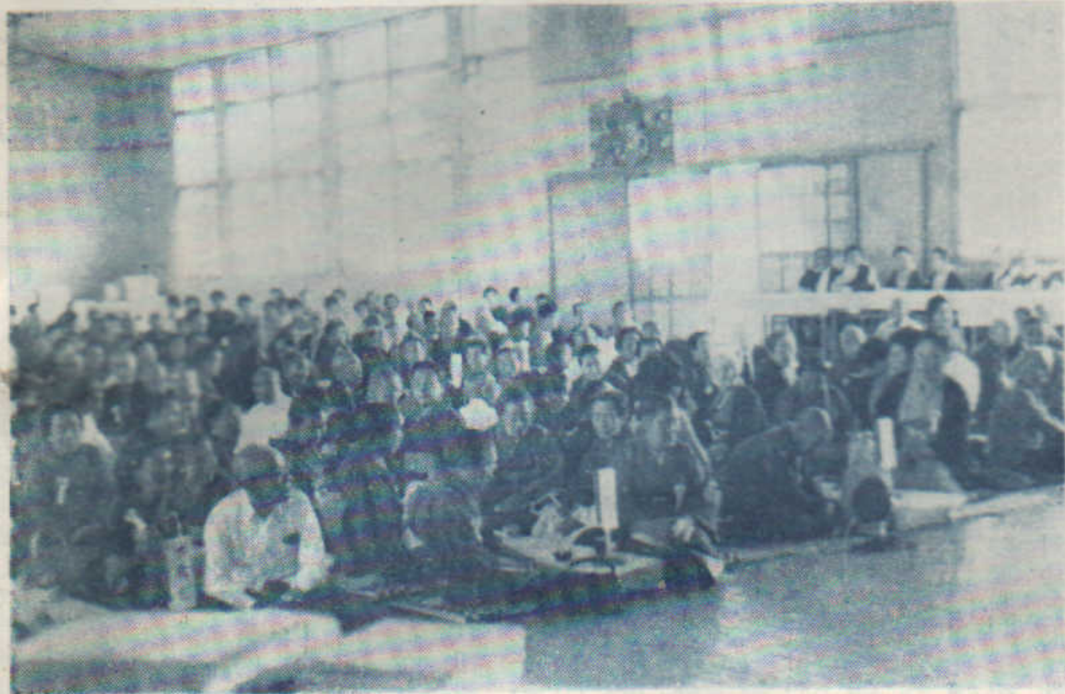
— 43. 9. 新屋町敬老会風景 —

この外に今年から地域の人々から寄せられた香典返しをもって地域内の児童遊園地補助金と災害事故防止標識設置費に充てることにしました。