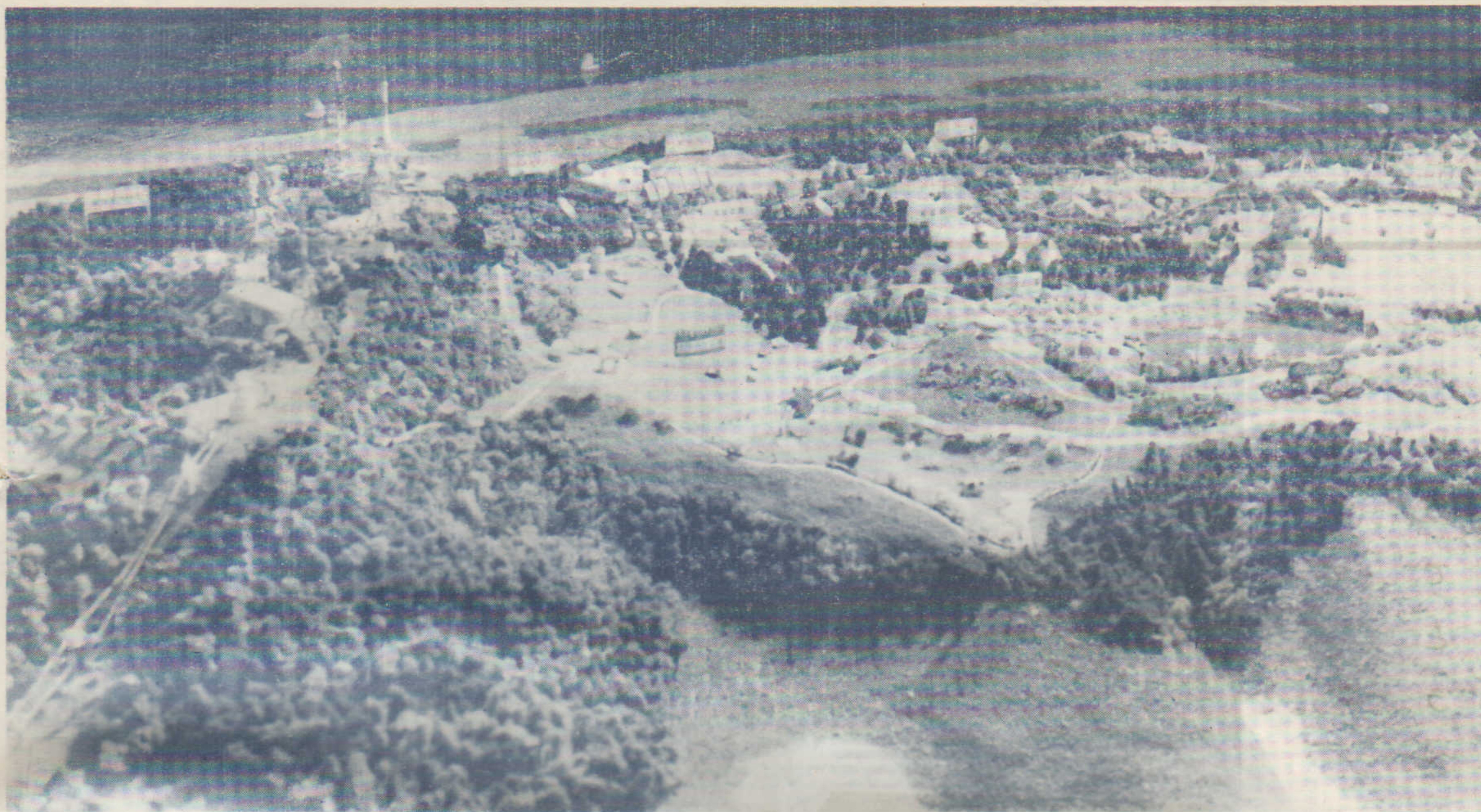
— (大 森 山「子 ど も の 国」予 想 図) —