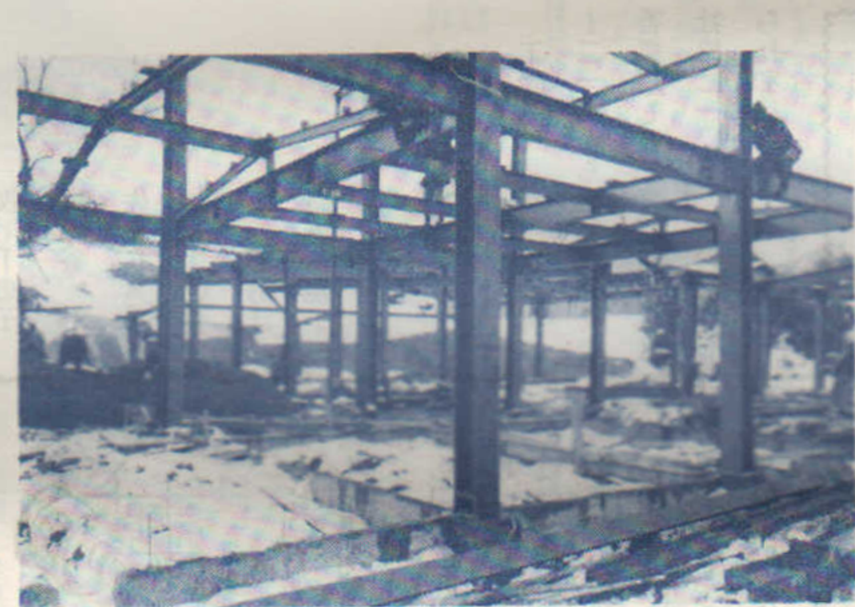
第一保育所工事現場 (12.17現在) (関町旧石沢氏宅跡)

そのためにはまづ今年度 こそは特に老朽校舎日新小 学校の新改築の促進と実現 を図るべく決意を新たにし ております。また下水道施 設についてはすでに国道七 号線西側が九〇％完工をみ ておりますので漸次表町新 町の西部小学校も三月末 町後方面に拡充しなければ