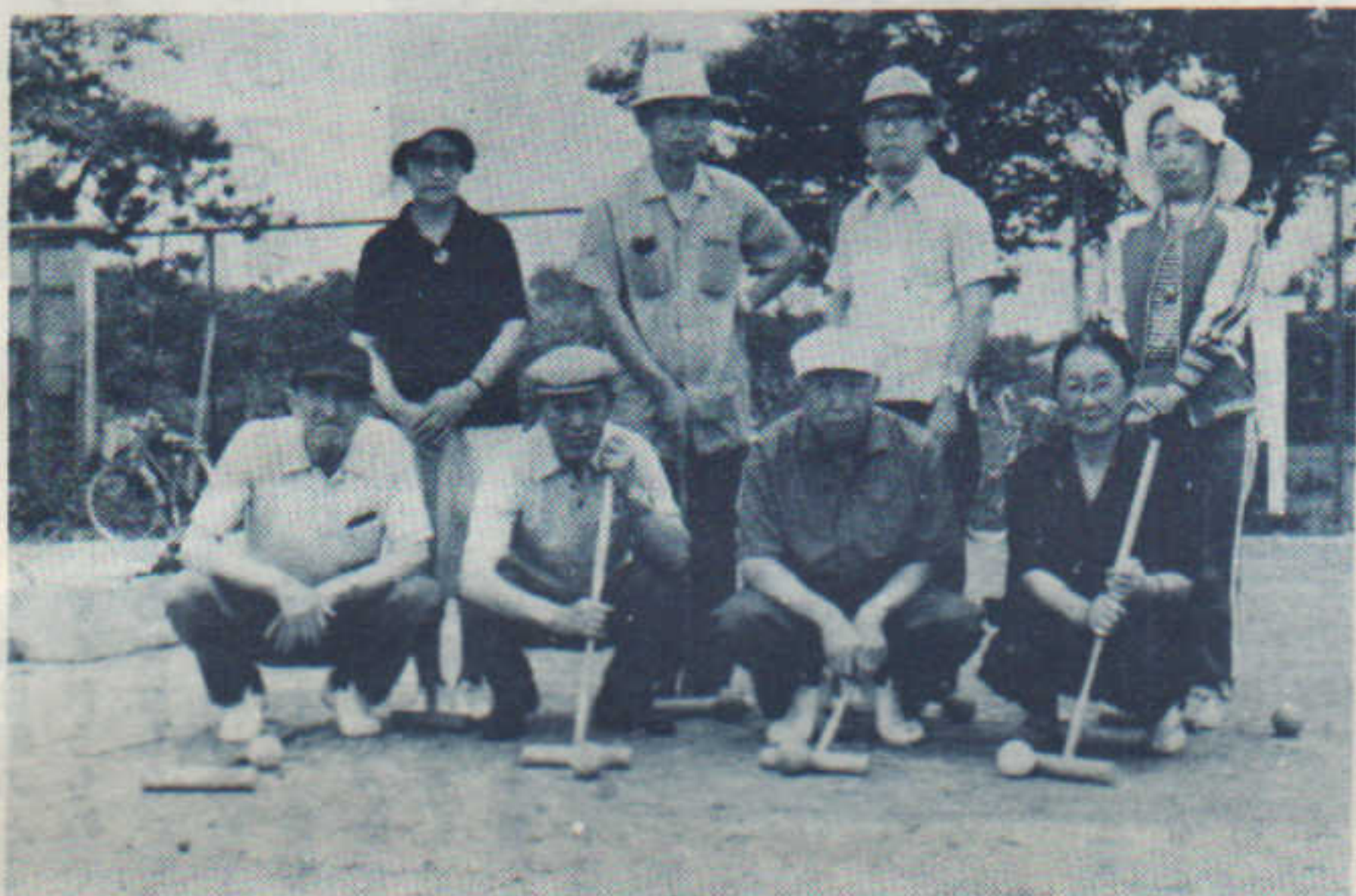
(ゲートボールメンバー)