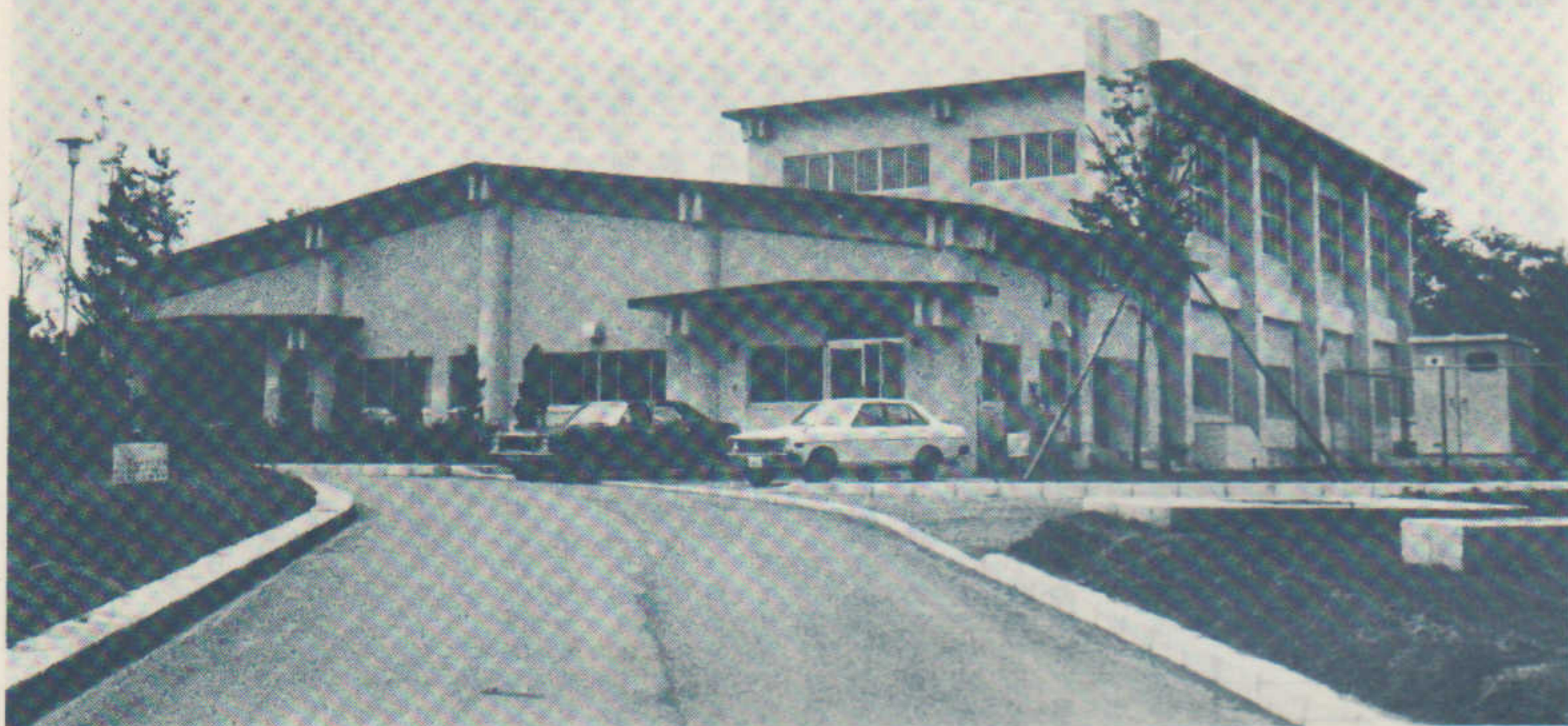
▲ (大森山老人と子どもの家)

「大森山老人と子どもの家」が完成して早や三ヶ月、その間秋田市の老人クラブはもとより市外の老人クラブの方々や子ども会の方々の利用が盛んで、今年度日、年末年始の予約がすでに万ばいの状態と聞き、ご老人の意