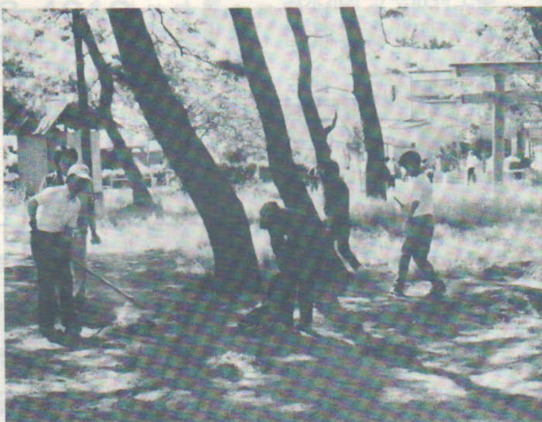
栗田神社境内の清掃奉仕

帰省する。寄宿舎は第二の家であり、自宅では味わうことのできない楽しさがいっぱいである。核家族とも言われる中で、このような集団をとおしての色々な体験は、時には厳しくもありまた人生のオアシスとしての色彩もあわせもっている。ちえ遅れの子ともを扱って