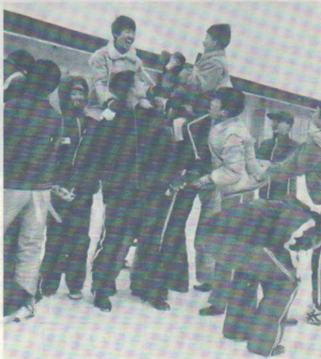
雪の騎馬戦・元気な笑顔