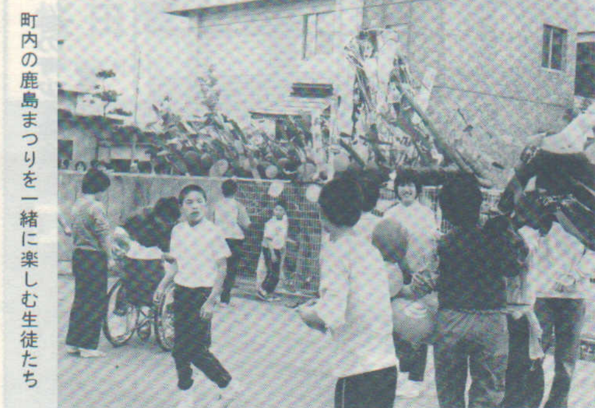
町内の鹿島まつりを一緒に楽しむ生徒たち

それに反応するかのようになり子どもたちは「何かで力になりたい」という意欲が脳裏をかき立てる。金生や年長の高等部生は、自発的に栗田神社の清掃に近所の人たちと一緒に参加したり、廃品の提供をかねて出たりする。寄宿舎の七夕花火会には、近くから六十余名も集まり予定の時間を延長するほどの盛況であった。時には、お手伝いのつもりが足手まといの結果になることもあったのではないだろうか。また、子ども心のいたずらが大きな迷惑となることもあろうかと懸念される。その時は、どうか一報下さることをお願いしたい。