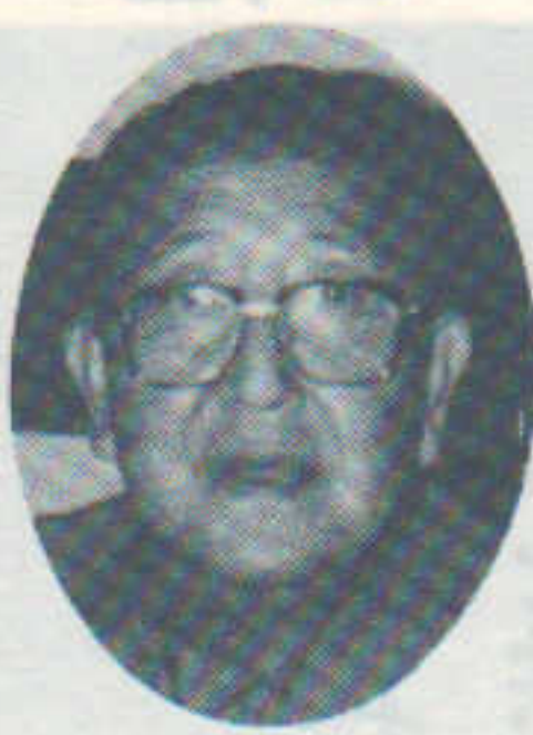
中川 前から興味を持っていたことに「衆報」二十五周年記念の座談会の際に栗原さんが、お話しされたように、「新屋衆」というのは人の足を引つぱり、仲々自由に行動が出来ない処だなあ、そこで「衆報」を作っているいろいろな事を書いて、町民の意識を変えていくのだと、そのことから始まった。ここに私は興味を持った。