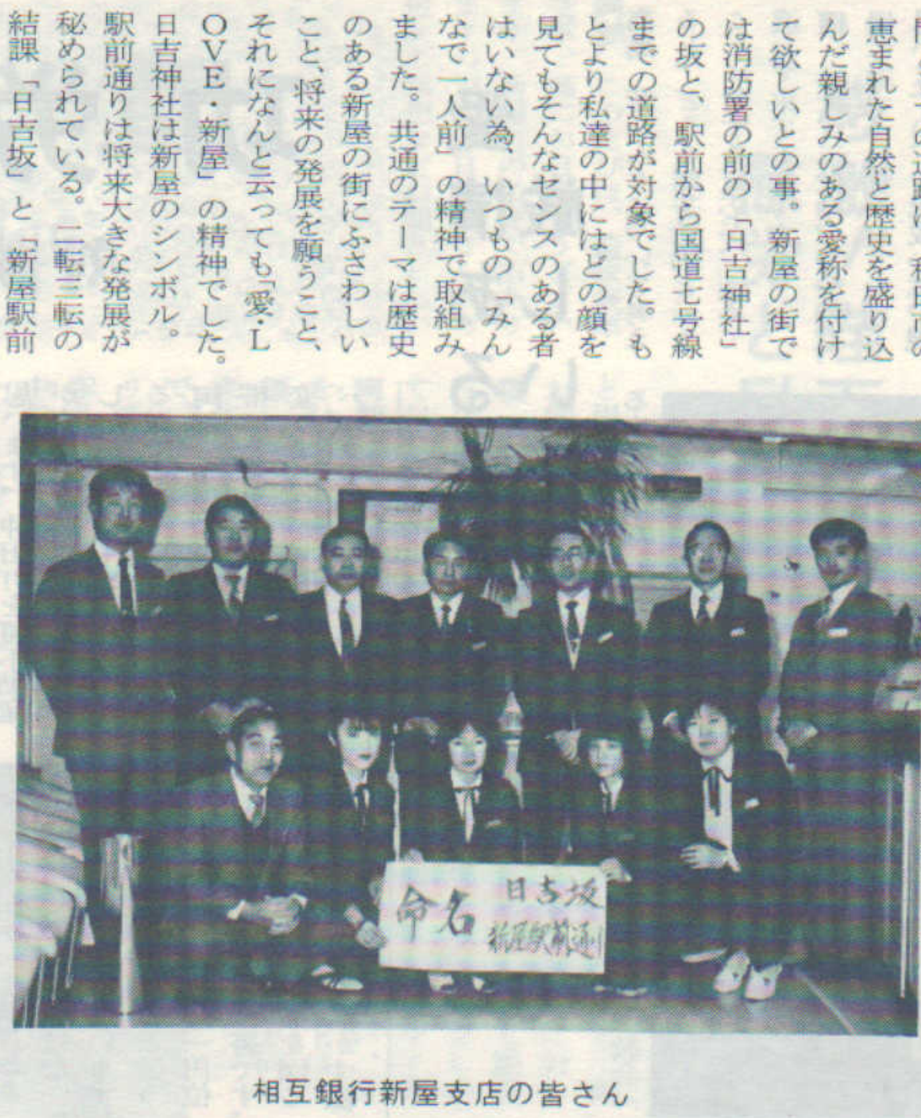
相互銀行新屋支店の皆さん

私達は、どうすれば地元の人達から愛され信頼されるか日夜悩んでいます。そんなある日、若い行員の一人が「みんな新屋の街の道路の名付け親になって見るべえ」と持って来たのが、秋田市で募集していた「道路の愛称応募要領」でありました。その趣旨をみると、昔ながらの生活空間としての道路に、秋田市の恵まれた自然と歴史を盛り込んだ親しみのある愛称を付けて欲しいとの事。新屋の街では消防署の前の「日吉神社」の坂と、駅前から国道七号線までの道路が対象でした。もとより私達の中にはどの顔を見てもそんなセンスのある者はいないが、いつもの「みんな」で一人前の精神で取り組みました。共通のテーマは歴史のある新屋の街にふさわしいこと、将来の発展を願うこと、それになんと云っても「愛・L・OVE・新屋」の精神でした。日吉神社は新屋のシンボル。駅前通りは将来大きな発展が秘められている。二転三転の結果「日吉坂」と「新屋駅前通り」に決定し応募しました。その後、日常の雑用で追われ、結果については、期待もしていなかったし、正直云って皆忘れていました。六ヶ月後のある日、市の方から二カ所共選定の報に一同びっくり。広報で知った人からは「オランダ坂」や「神楽坂」など、「坂」が付けばムードがあつて親しみ易く、駅前通りは限らない。発展のイメージがあると云ってくれた。