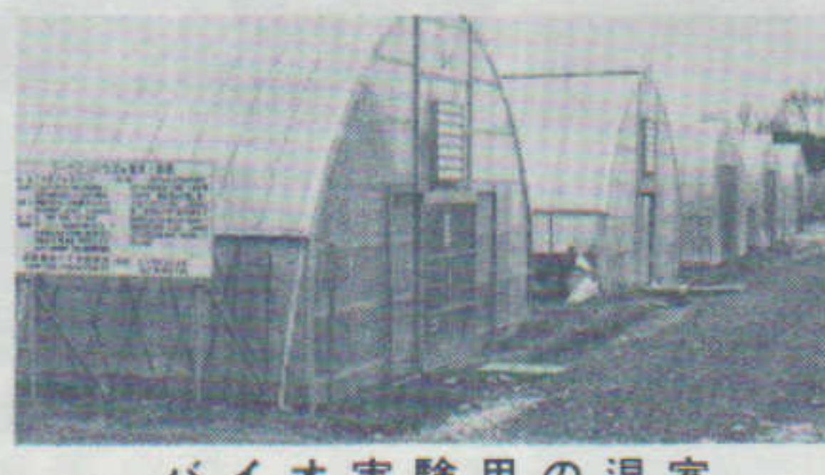
バイオ実験用の温室

最近の新聞、TVで大きく報道されておりますように、米の自由化等、我国の農業を巡る状況はかなり厳しいものがあります。しかし、食糧は基本的に自給すべきものです。