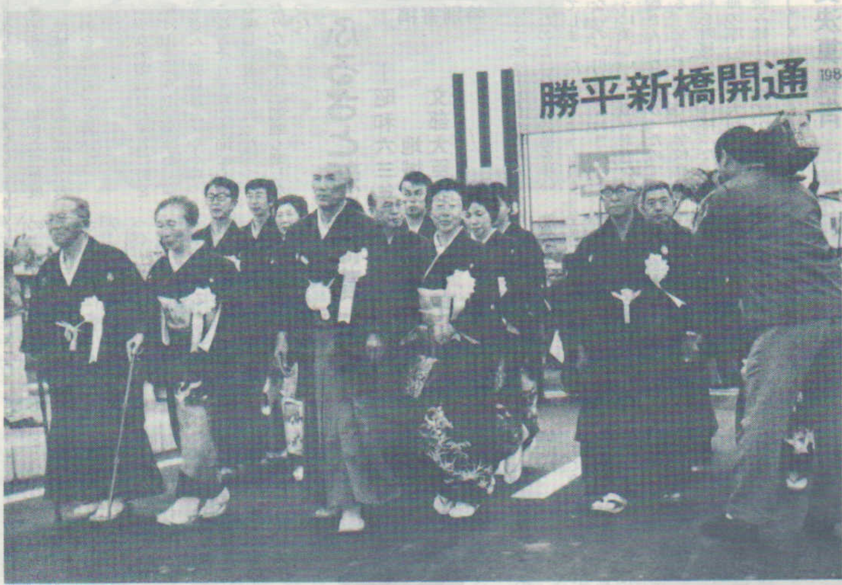
三代夫婦三組の渡り初めで開通した勝平新橋

私も新屋振興会長として、地域の皆さんが、豊かな生活ができて、明るい日々を送ることができ、ますます、意を新たに、して地域振興のため努力いたす所存であります。 ご承知のように、三年前、高トル安の持統の影響を真に正面に受けた十条バルブが解散され、新屋の産業経済が大