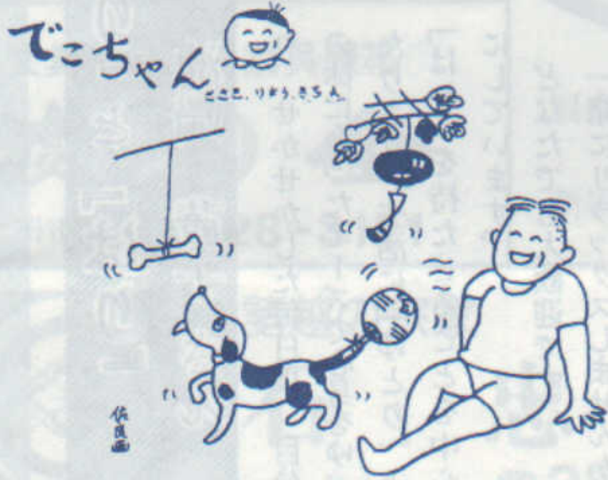
作者：佐々木良吉氏（新屋元町）