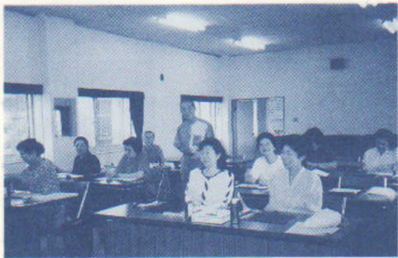
書道を楽しみながら学ぶ

婦人会の学習を通して同好会 になってまだ一年余りですが、 毎回来しくご指導して下さる先 生のおかげで幅広い年齢層（四 十代から七十代）にもかかわら ず、若い？熱気がムンムンして います。師範級の人、私のよう