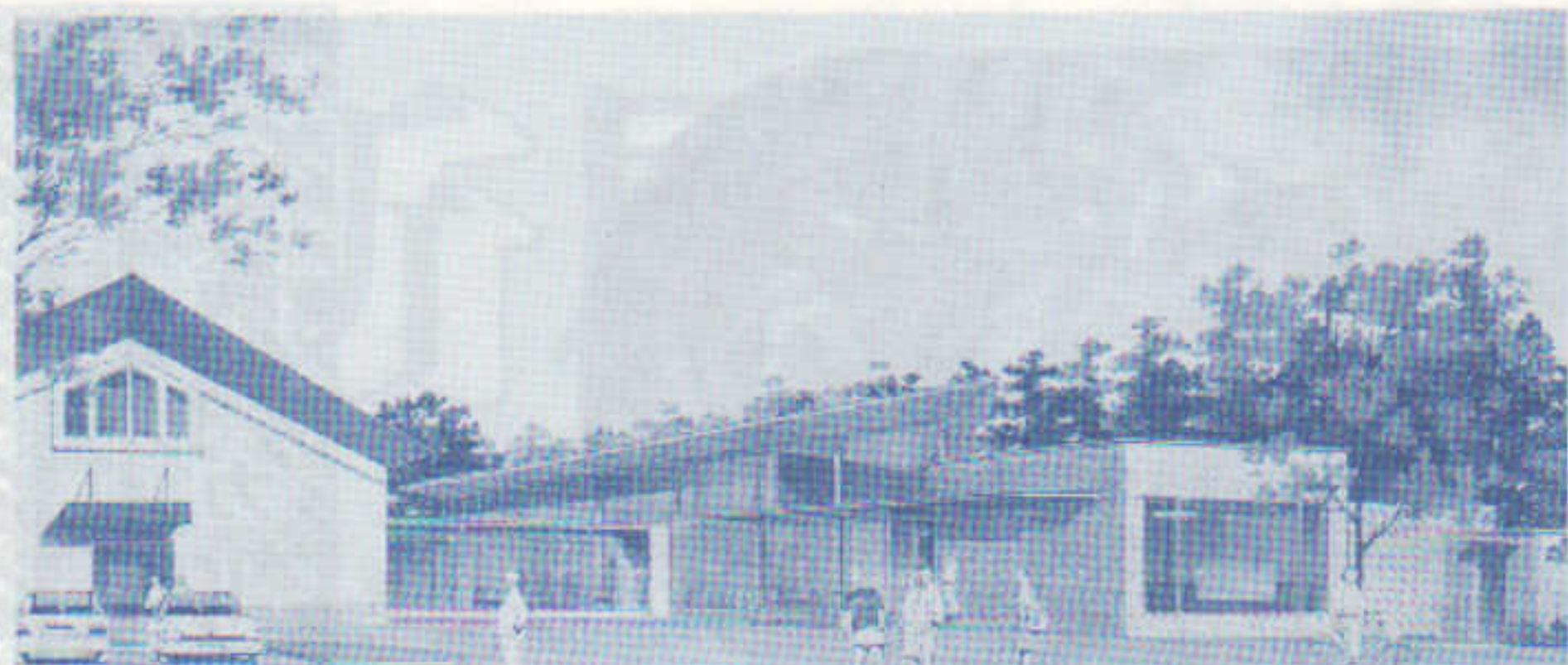
新しくなる新屋図書館の完成予想図