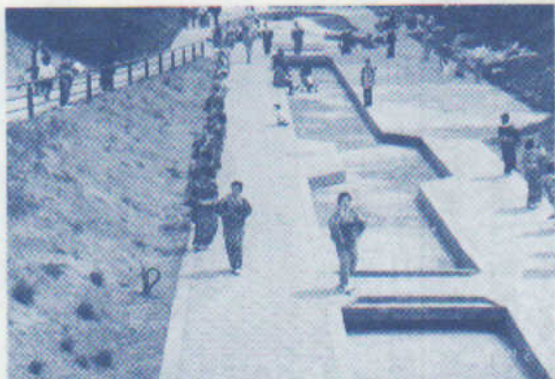
進行中の带状公園で華やかに観桜会が開かれた<H9.4>

1、プレーゾーン （幼稚園から桜橋間） 2、（上流）親水ゾーン （桜橋から新屋橋間）