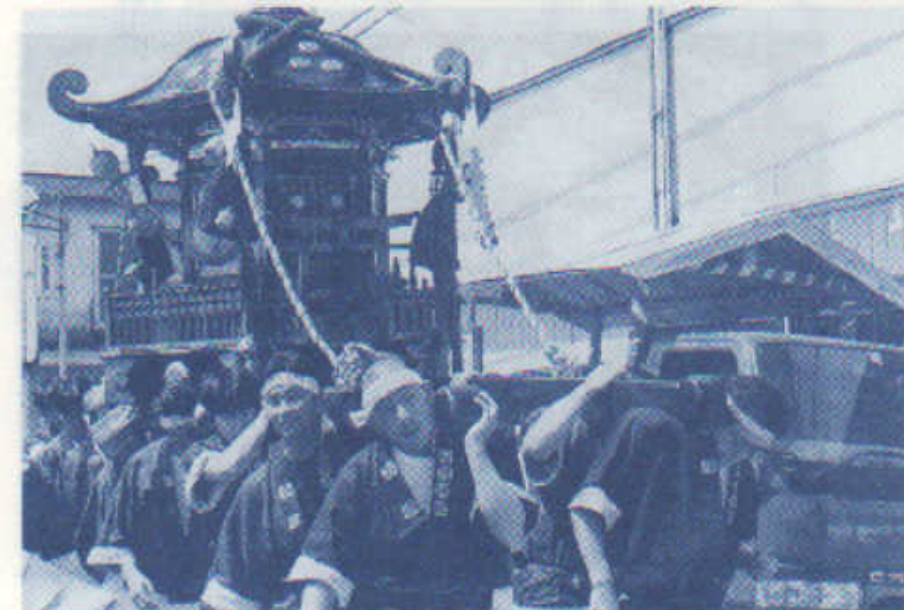
男みこし

によりやく筆を持てるようになっ た者などさまざまですが、実用 習字という事で基本練習から身 近な歌を書いてみたりと毎回変 化があって楽しいサークルです。 第二、第四木曜日の午後一時 半から三時半までが練習日となっ