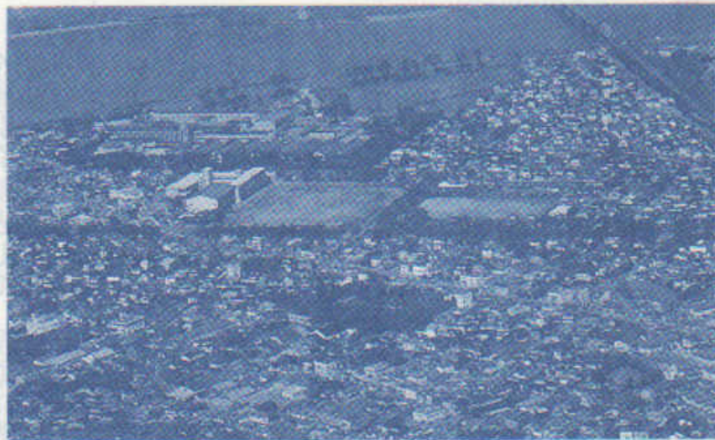
空から見た西中学校周辺

の事項などについて四十名もの各町内会長・振興会理事を交えて検討が加えられ、八月下旬を目標に関係機関へ要望書を提出することになりました。