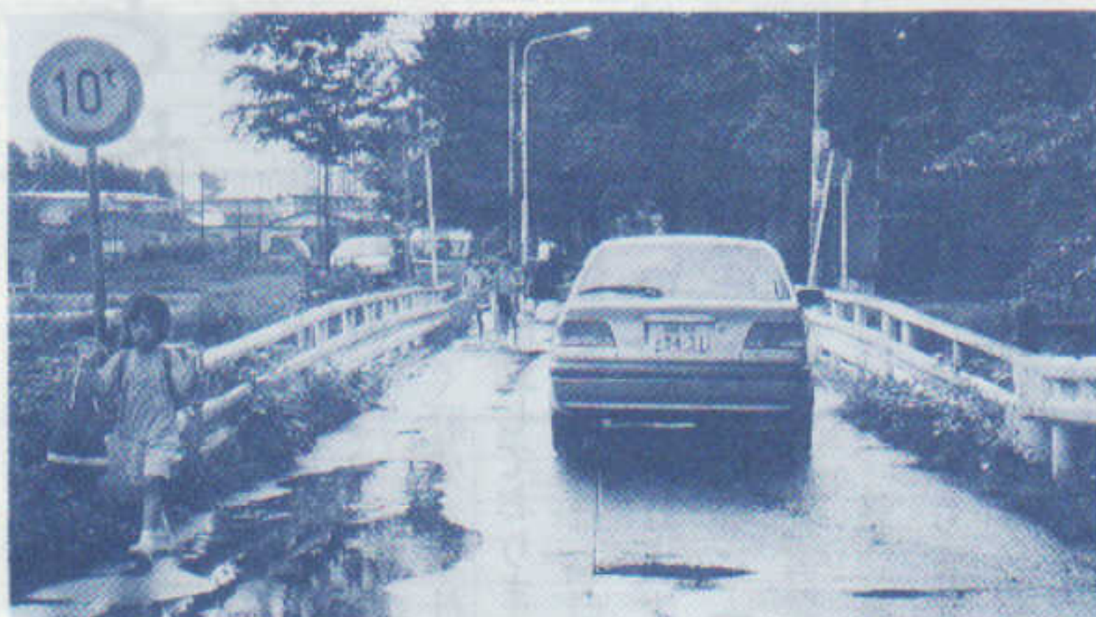
現在の桜橋の利用状況

三、アトリエももさだの休館日について 現在アトリエももさだの休館日は、平日祝日にかかわらずなく月曜日となっておりますが、今年の五月五日の子供の日(月)に地域イベントを開催すべく、大学事務局に粘り強