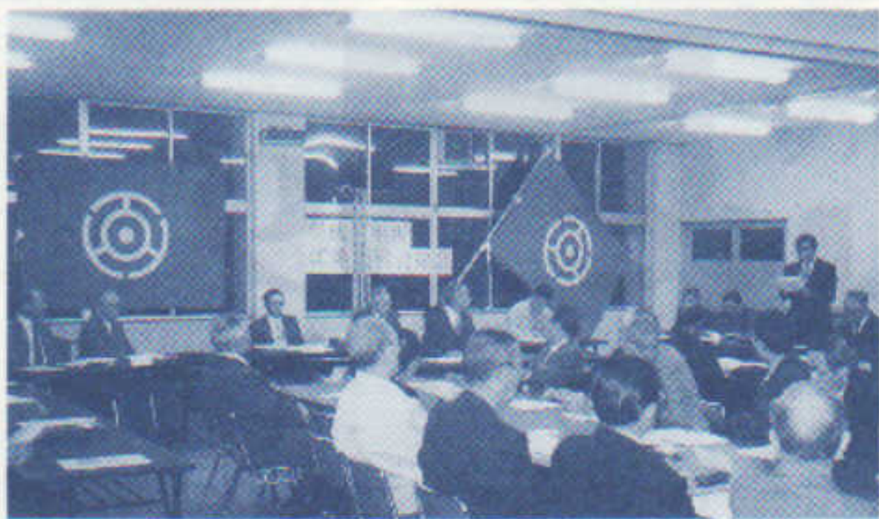
平成9年度定期総会 (H9. 4. 22)