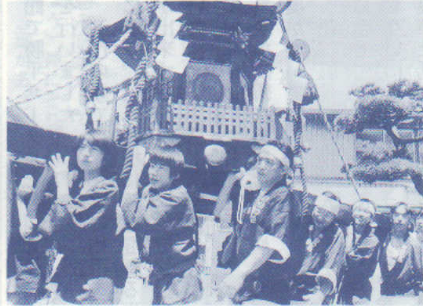
日吉山王大祭 H10・5・25・26