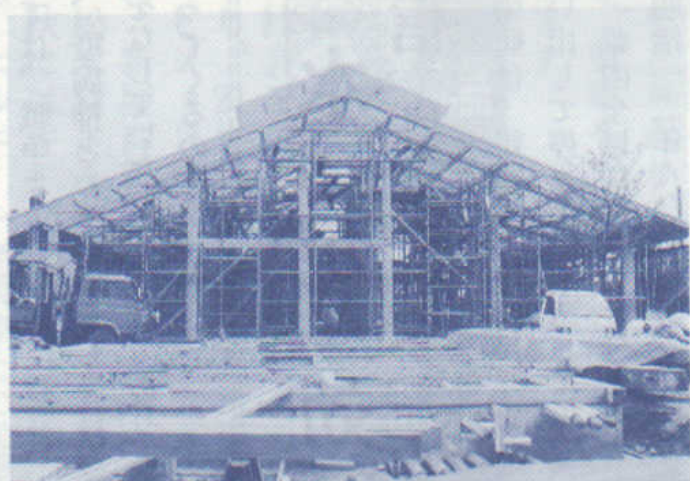
建築中の「長寿温泉」の現場