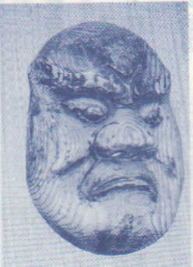
《愛宕町地藏さんにある 木彫りの大面》

葬し、皆で厄払いのつもりで、貰ったお金で酒を呑んで寝てしまった。 それから数日たって、その漁師の一人が疫病にかかり苦し