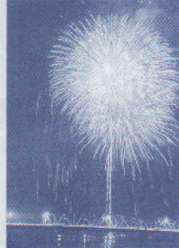
夏まつり花火大会 8月10日 PM7:00~9:00 雄物川河川敷(雨天は翌日)