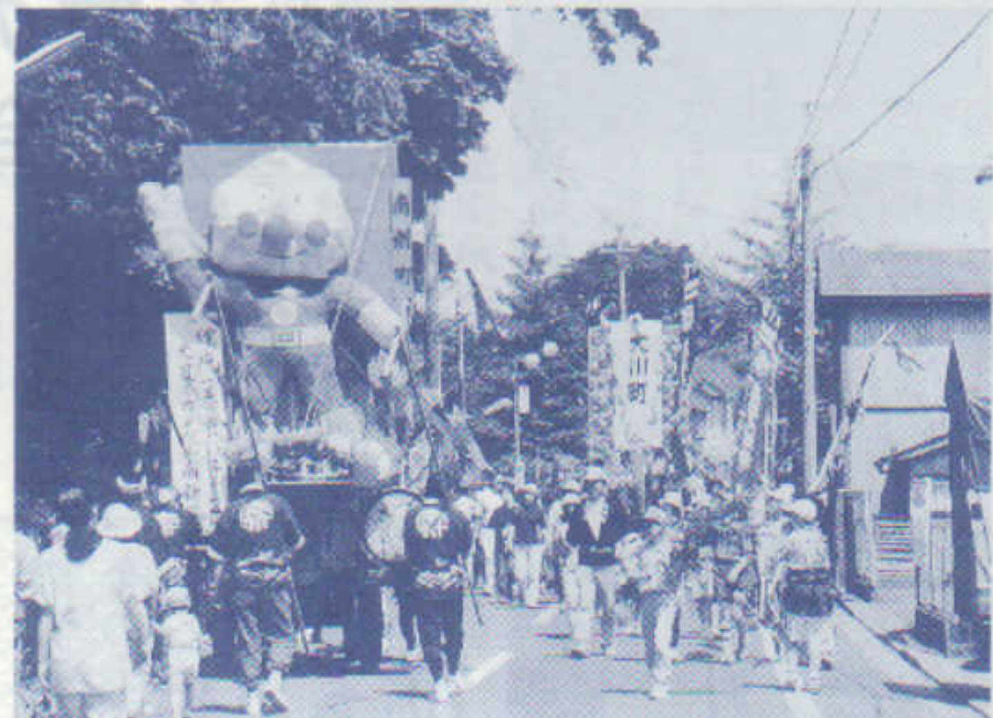
鹿嶋流し祭り H10・6・14