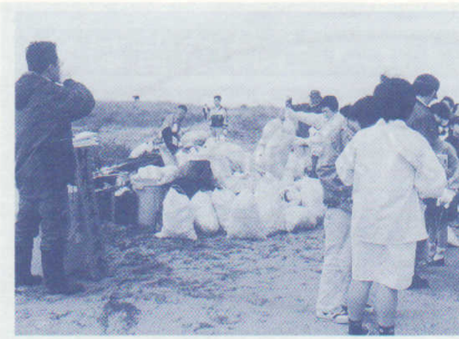
海浜公園 クリーンアップ作戦 H10・6・7