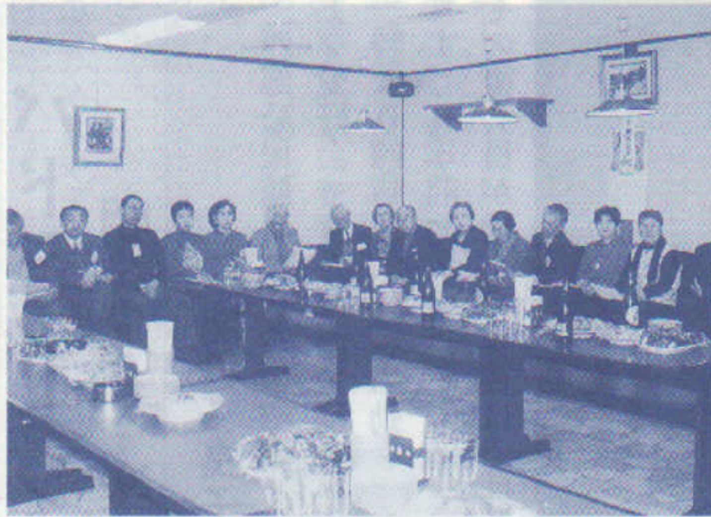
第23回新屋郷土会総会開く H10・1・31 於・東京