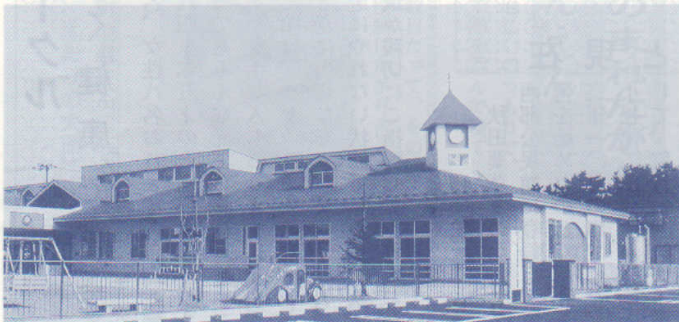
日新保育園新築落成 H10・3