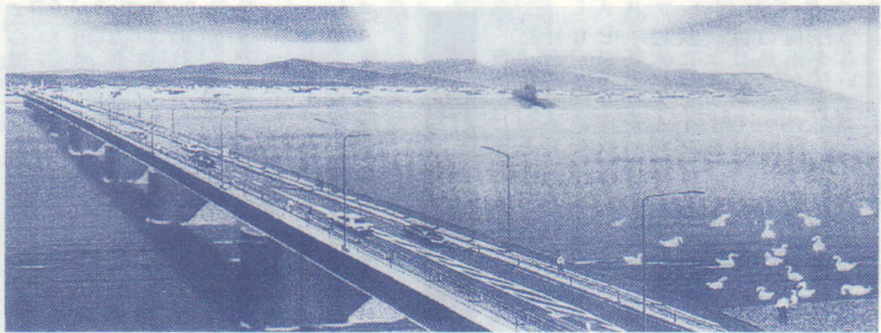
秋田大橋架替 工事はじまる 平成13年完成予想図

昭和八年七月に新屋町社会福祉事業協会第一託児所として開設されて以来六〇余年、新屋町にとっては伝統と歴史のある保育園です。この程、関町後にとんがり帽子に時計をあしらった、子供の国のような日新保育園が三月に新築落成しました。 定員二〇〇名、職員二五名です。