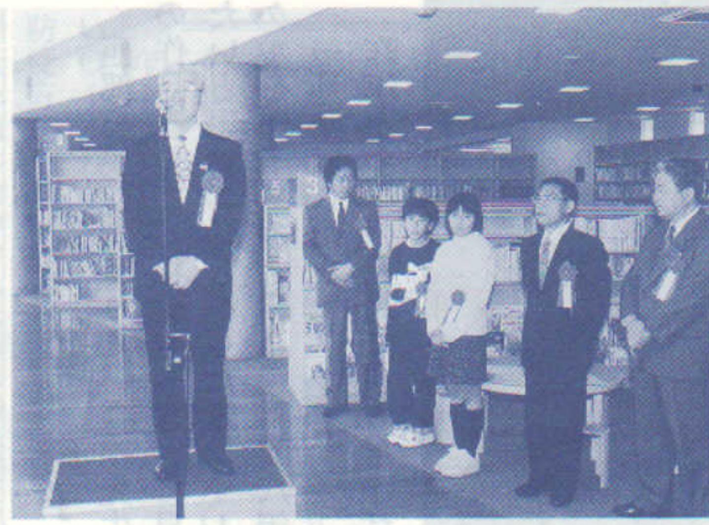
新屋図書館新築開館式 H10・4・17