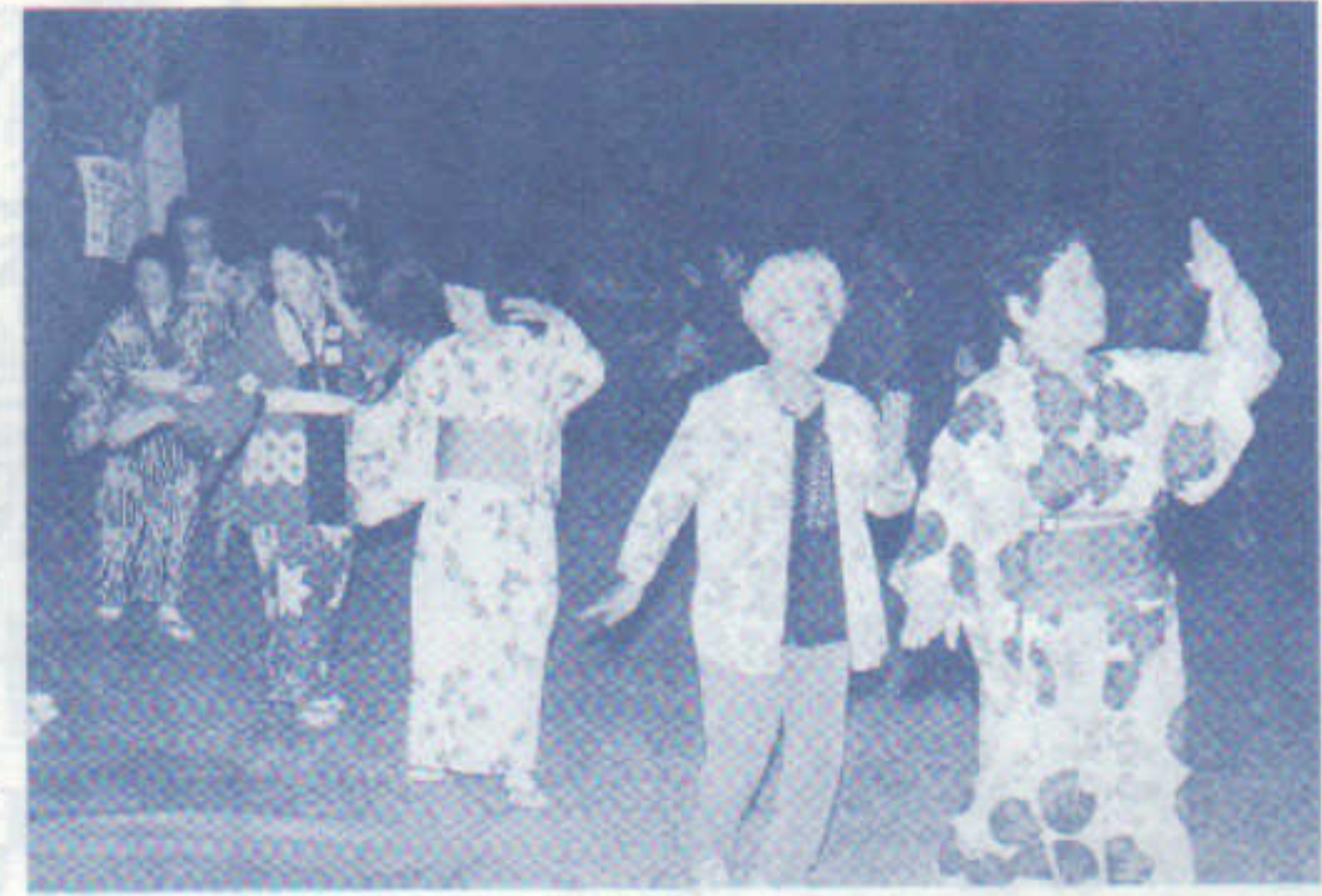
〈盆踊りに興じる人々〉

その境内は児童公園になっていて、無心に楽しそうに遊ぶ子どもたちの声や散策に訪れる人々の笑い声が聞かれます。それに、地域的に自然の推移が豊かに見聞できるよさがあり、春には庭先の木々にウグイスが春を告げに訪れ、人々の心を和ませ、初夏には早朝からカッコウがさわやかな声を聞かせ、人によっては、その声で畑仕事を判断したりします。秋にはキノコとりと人々を楽しませ、冬には白鳥の群れが町内の上空を鳴きながら回り、雄物川へと下りて行きます。また、雪が降ると、キジが木の芽や実をあさりに姿を見せるのも珍しくありません。