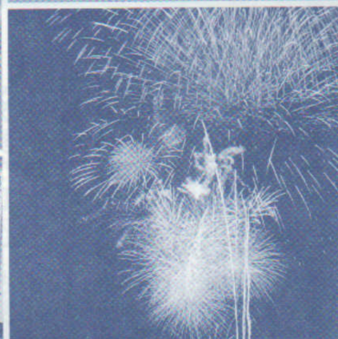
恒例の雄物川花火大会 8/10