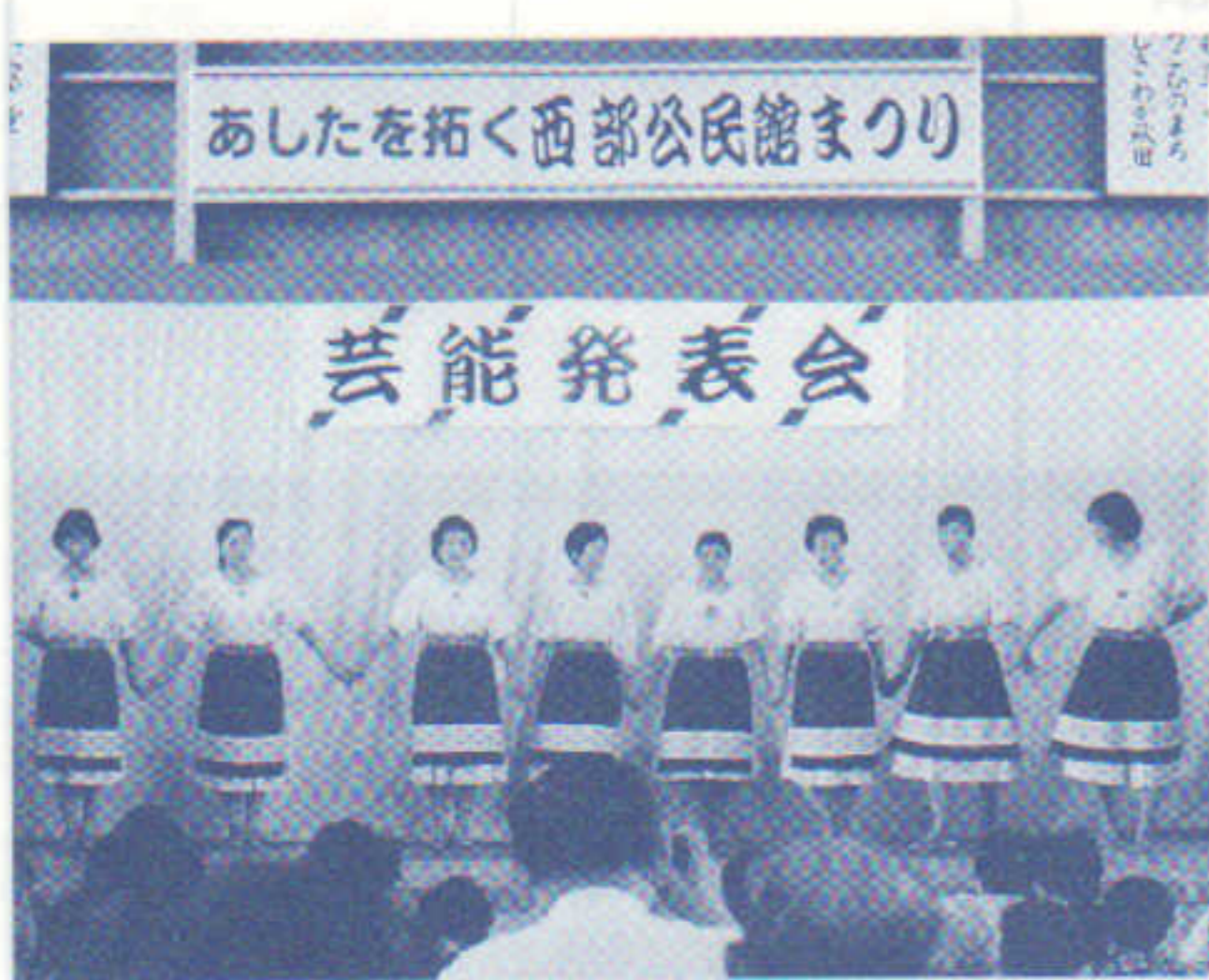
〈心うきうきのアルプスのハイジたち〉

「西部きりえ会」は、会員の誰よりも若い女性の講師と頼れる白一点の男性を含めた一〇人の会員で活動しており、昨秋の「西部公民館まつり」が三度目という日の浅いサークルです。