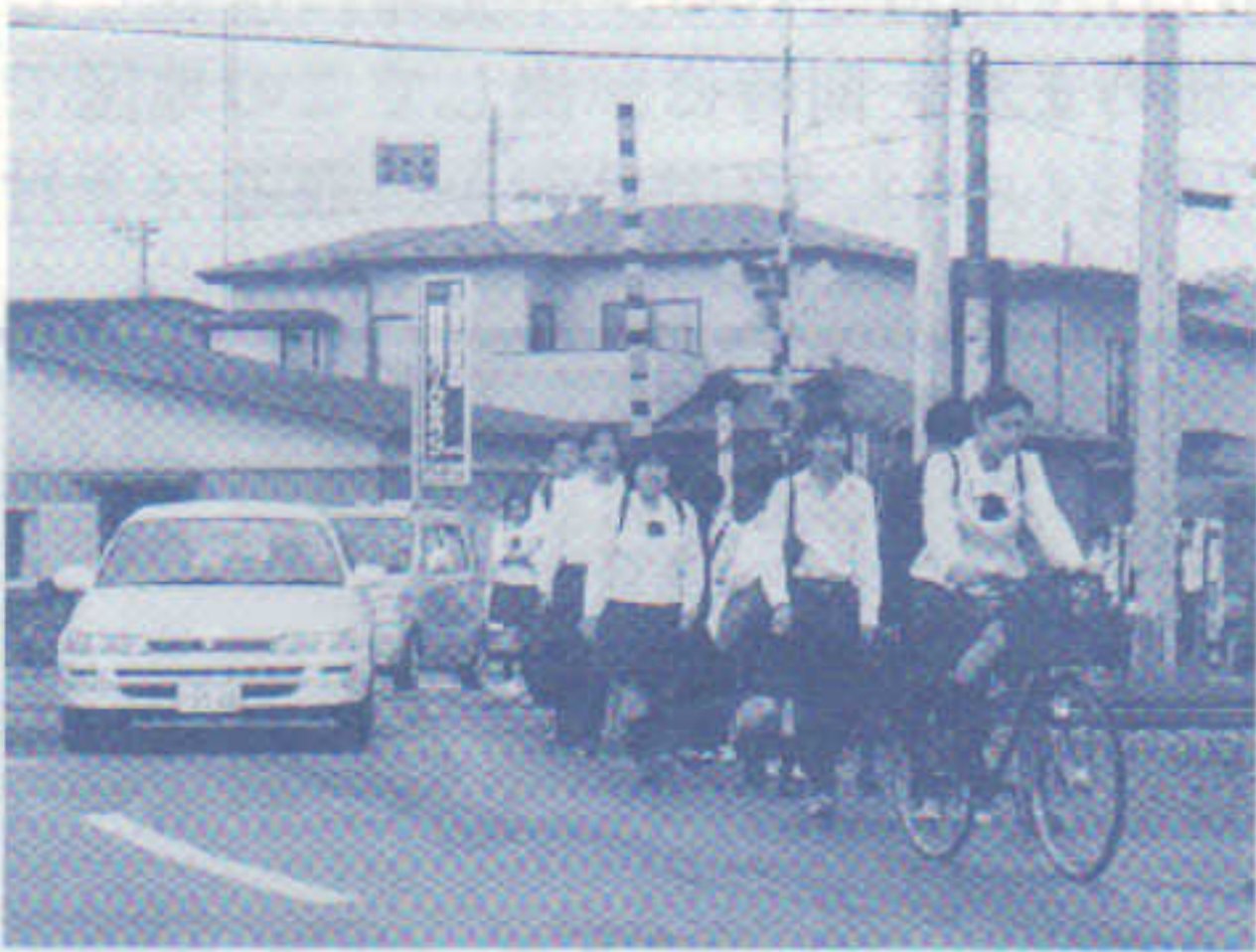
〈狭くて危険な踏切り〉

回答 橋梁整備については、老朽化の著しい橋梁の補修による対応としており、架け替えについては早急な対応は困難です。