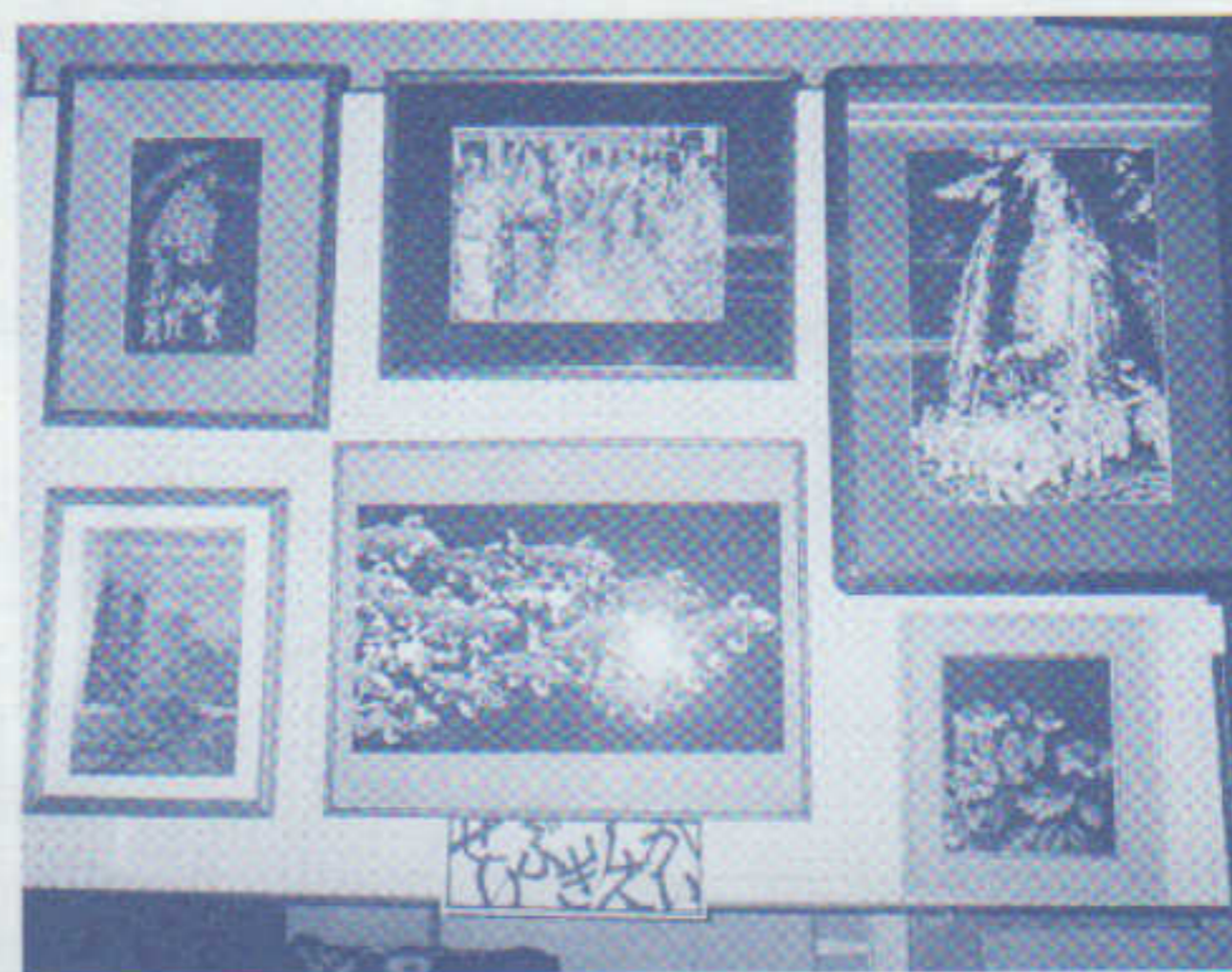
〈美事にできた きりえ〉

会員で誘い合って「全国巡回きりえ美術展」の鑑賞に出掛けたことがありました。ハイレベルな種々々なきりえの作品を間近にし、手法にきまりはないと感じ、その分きりえの奥深さを認識しました。