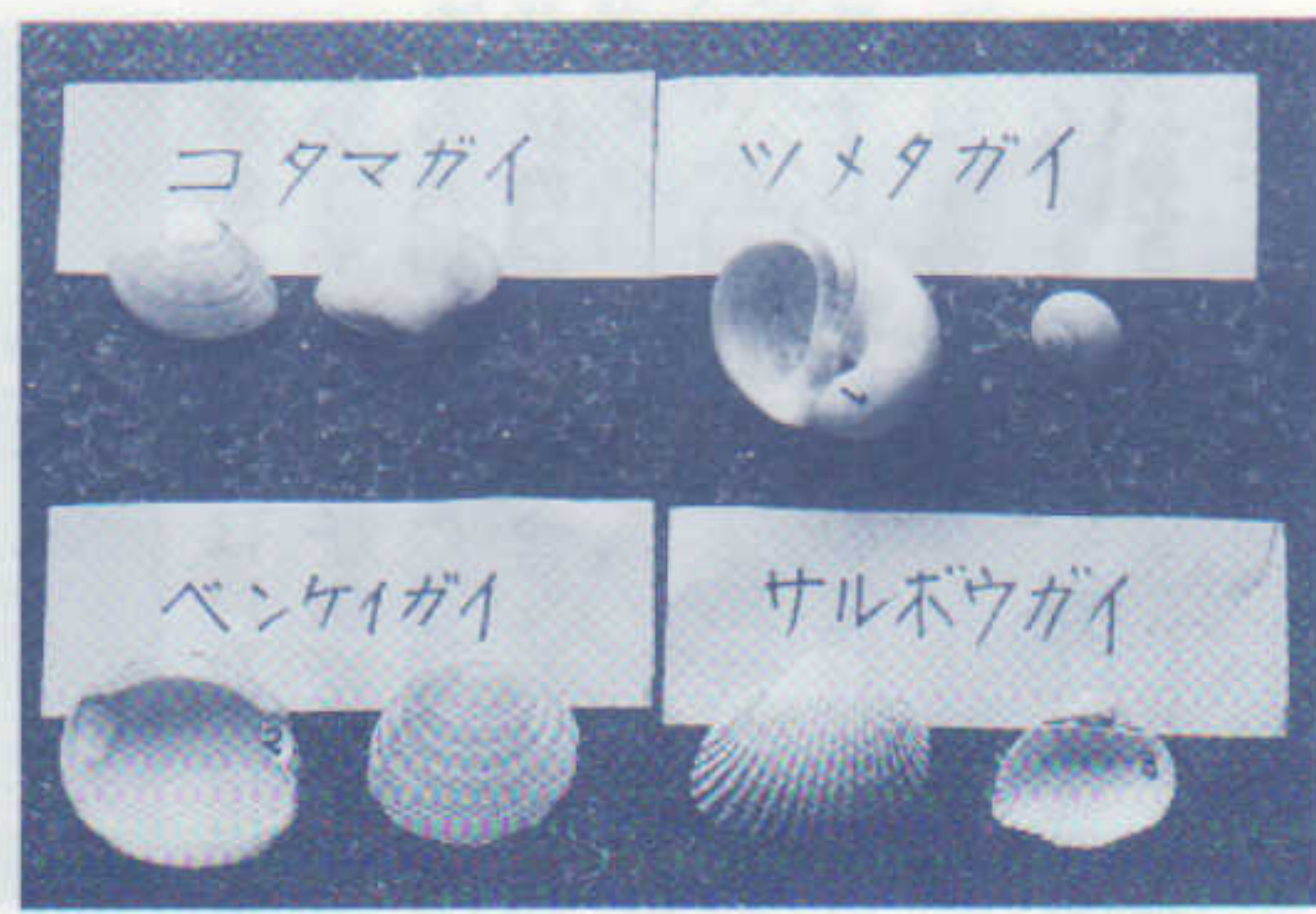
〈発掘された貝塚の一部〉