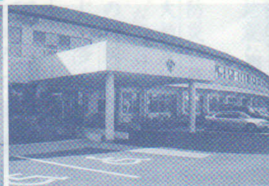
改築された養護学校11/22