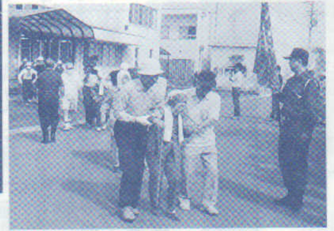
防災訓練「だいせん」9/1 新屋バカ市の賑わい9/23