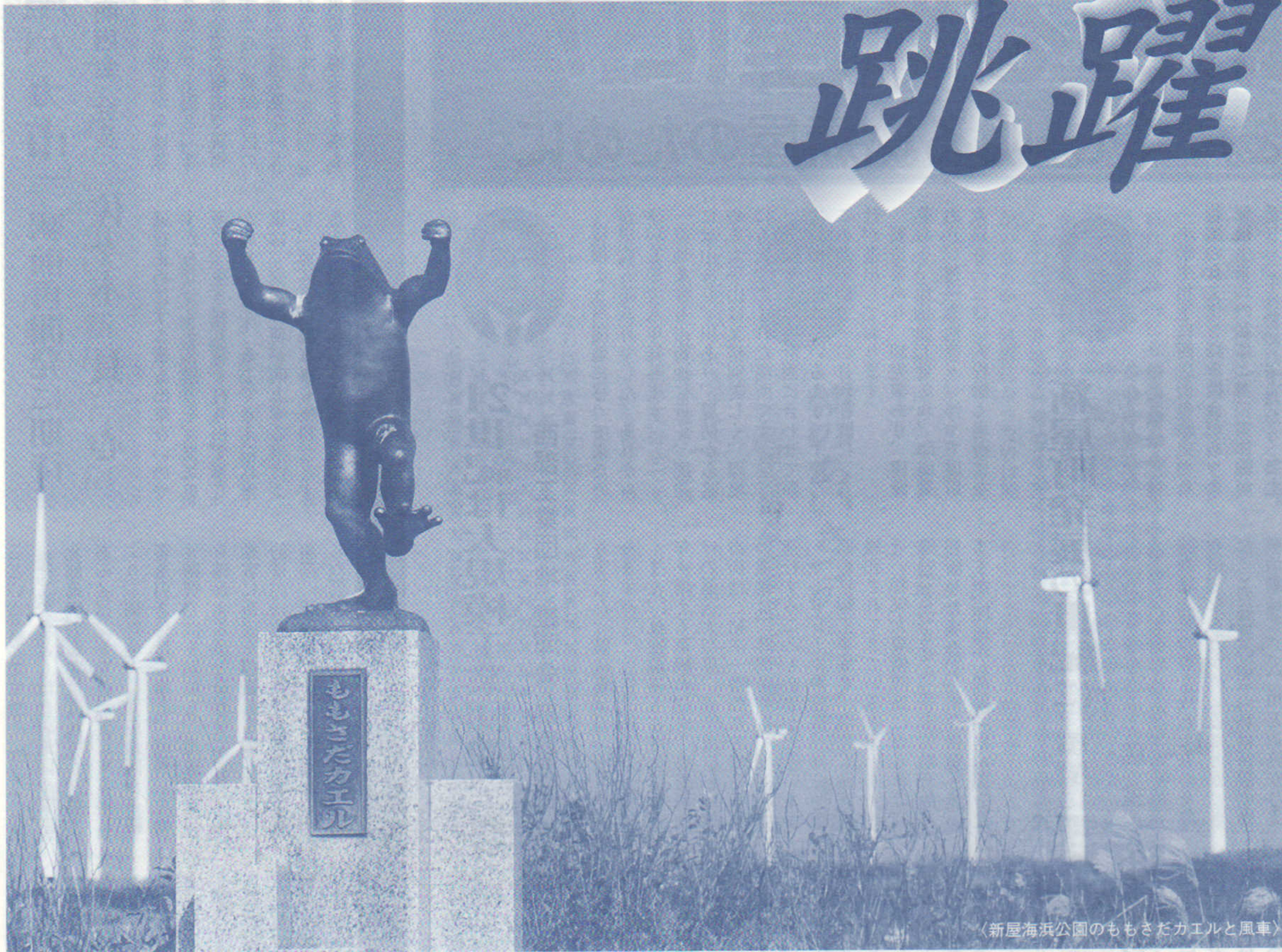
〈新屋海浜公園のももさだカエルと風車〉