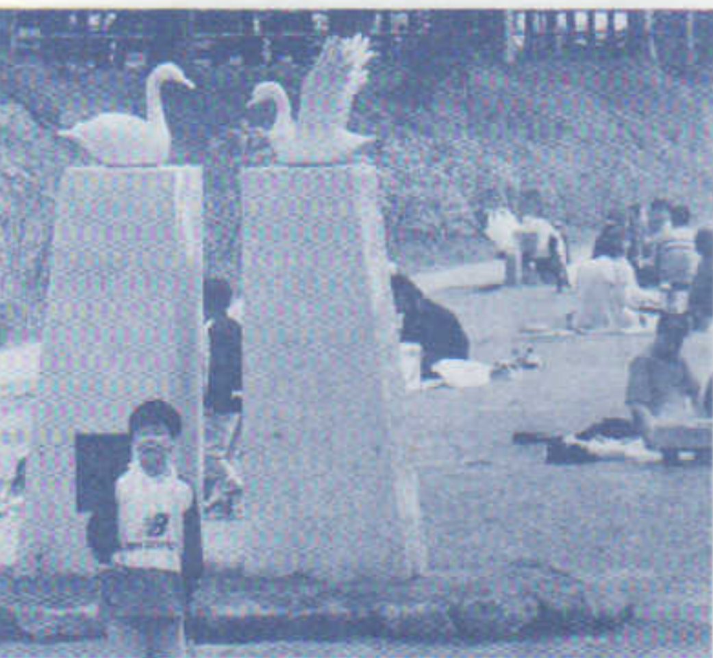
〈モニュメント付近〉